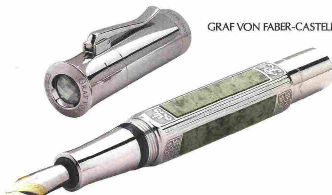
GRAF VON FABER-CASTELL